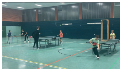
So langsam füllt sich die Turnhalle wieder mit den eifrigen Tischtenniskids beim gemeinsamen Training.