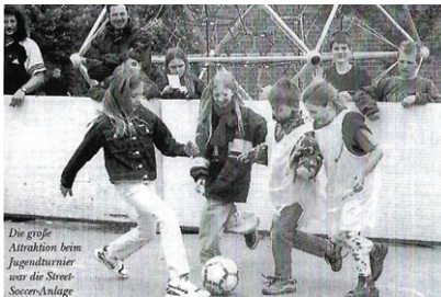
Die große Attraktion beim Jugendturnier war die Street-Soccer-Anlage

Die Jugendabteilungen des Vereins führen gemeinsam eine Großveranstaltung mit diversen Angeboten ihrer Sportarten durch, als Attraktion wird eine Street-Soccer-Anlage aufgebaut.