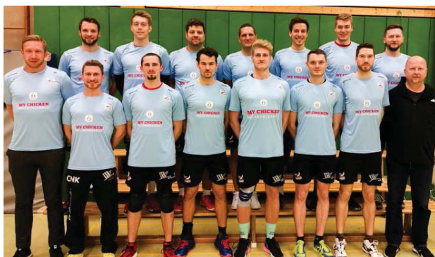
Einspiel-Shirts für die ganze Sparte haben wir über unseren neuen Sponsor bekommen.