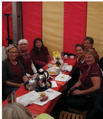
Gespannt auf das Schießergebnis!