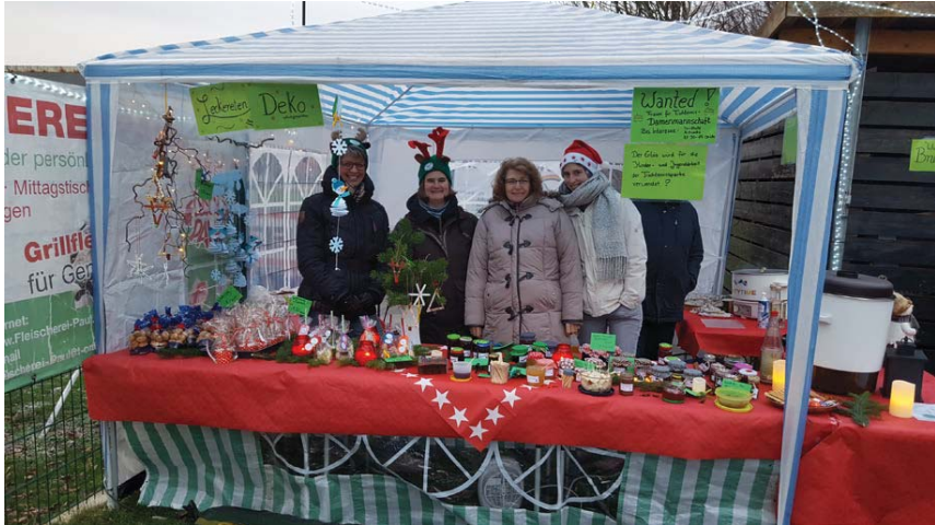
Stand der Tischtennisabteilung, die Kinderpunsch, selbstgebastelten Weihnachtsschmuck, Nüsse und Likör im Angebot hatten.

31241 Ilsede • Gerhardstr.44a ( B444 ) • 05172-4398 • service@merkel-pokale.de