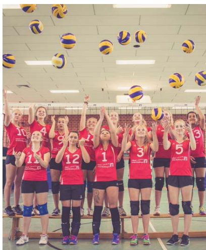
Freut sich auf Neues im Training, die 2. Damenmannschaft der VSG.

Reserveteam der VSG stoßen kann. Hier steht auch ein Trainerwechsel kurz vor dem Abschluss. Dazu mehr in der nächsten Ausgabe des Echos.