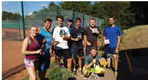
Beim Tennisturnier gab es an diesem Tag nur Gewinner!