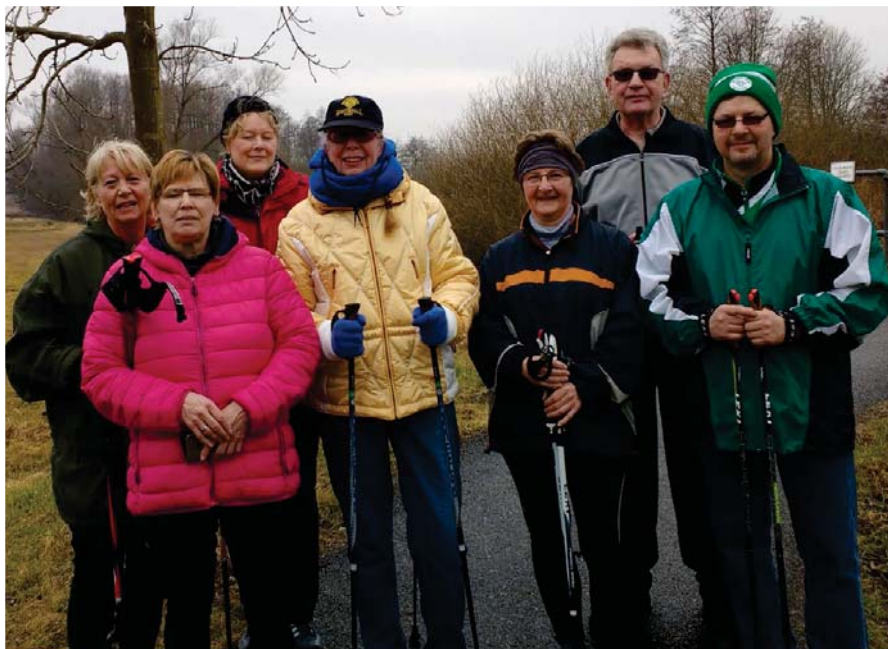
Auf zu neuen Taten, unsere jüngste Abteilung, die Nordic Walking Truppe ist bei jedem Wetter aktiv und zieht ihre Spuren durch die Feldmark.