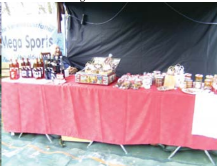
Uwe Bensch bietet Schwibbögen an.