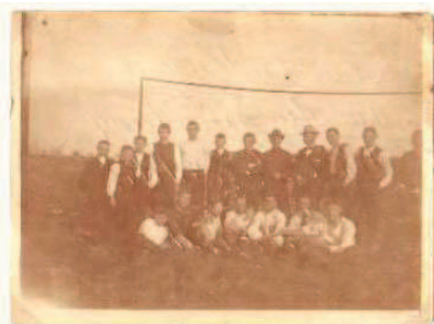
Zur Erinnerung an die Gründung des FC Adler Vallstedt 1916