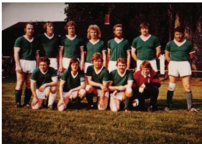
Unteres Bild: Kreispokalsieger 1976