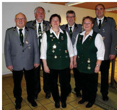
Foto von links:

Wir wünschen uns, dass auch in diesem Jahr die gemeinsame Arbeit so gut gelingt wie im letzten Jahr.