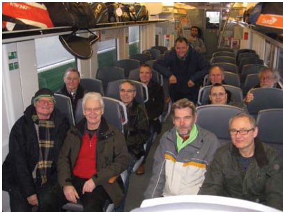
Erstmals im Bus auf Tennisfahrt, die Männerrunde.

Tennisfahrt vom 26.02.16 bis 28.02.16 nach Hann. Münden: Unsere Tennisfahrt (Männer- runde) ging diesmal mit elf Tennisleuten wieder nach Hann. Münden. Als Transportmittel wählten wir erstmalig die Bahn. Alles klappte reibungslos und entspannend. Erster Anlauf- punkt vom Bahnhof war die Tillyschanze. Von dort ging es in unser Hotel. Alle freuten sich über die komplett schönen neuen Zimmer. Es gab wieder spannende Tennismatches und Freitagabend wurde gebowlt.