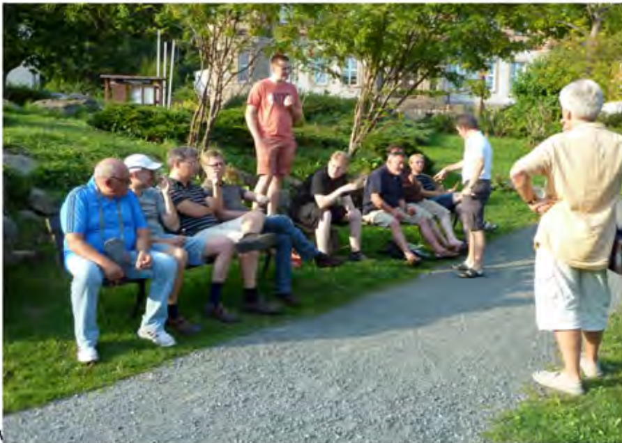
Die reiselustigen Tischtennispieler beim Verschnaufen im Kurpark von Schierke.

gegen Mitternacht die fröhliche Runde während der Nachwuchs erst gegen vier Uhr morgens ins Bett fand.