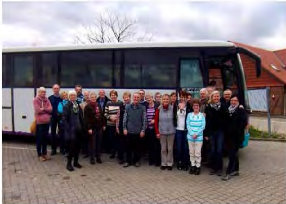
Gemeinsamer Ausflug in den Harz, die Kegler „Volle Zwölf“ und Mitglieder der Tennisabteilung vor ihrem Reisebus

Wir würden uns sehr freuen, euch persönlich begrüßen zu können.