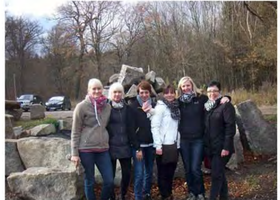
Die Damenriege der Tennisabteilung ist natürlich geschlossen am Start!