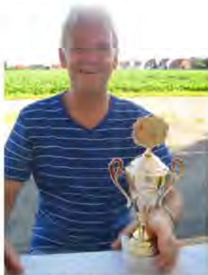
Die Prellballer benötigten die wenigsten Würfel!