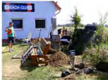
Das tolle Wetter hat das Buddeln recht schweißtreibend gemacht!

Nachdem der Holzunterstand wieder aufgebaut worden ist, haben die Volleyballer sich am südlichen Zaun zu schaffen gemacht. Dieser soll im Rahmen der Sanierung durch einen höheren Ballfangzaun ersetzt werden.