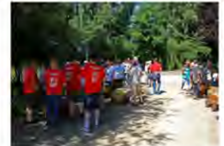
Startpunkt Alvesser Kinderspielplatz

wurde gestoppt um nach der Straßenüberquerung wieder im Feldweg am Mühlengrund die letzte Streckenetappe in Angriff zu nehmen, mit dem Ziel am Parkplatz des Vallstedter