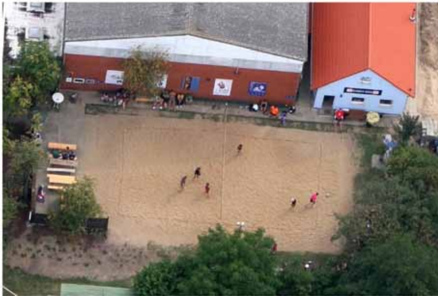
Die älteste Beachvolleyballanlage im Landkreis Peine steht vor einer Generalsanierung, das Bild zeigt die Vallstedter Anlage aus der Vogelperspektive beim Beachvolleyballweltrekord 2009.