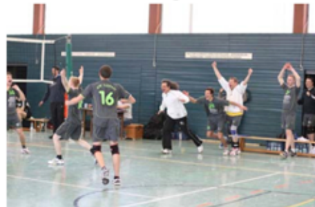
Nicht mehr zu halten waren Spieler und Ersatzbank nach dem letzten Punkt, der unserer Reserve den Aufstieg in die Landesliga beschert hat.

Vallstedts 2. Herrenmannschaft durfte Heimrecht genießen, erwartete als 1. Gegner den bislang unbekannt Kontrahenten vom TB Wendhausen. Vorher vom Trainer beobachtet, gingen unsere jungen Spieler mit dem nötigen Ehrgeiz und konzentriert ins Match. Bis auf kleine Nachlässigkeiten im 2. Durchgang wurde der Gegner insbesondere durch beeindruckendes Blockspiel mit 3:0 auf die Heimreise geschickt.