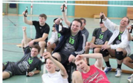
Nach 2 harten Ausscheidungsspielen schmeckt natürlich das Bierchen hinterher umso besser.

Vielen Dank sagen die GW-Volleyballer allen, die den Spielen beigewohnt haben, es ist lange her dass die Vallstedter Turnhalle so gefüllt war!