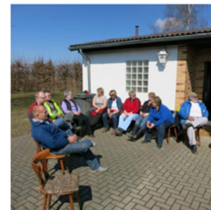
Das Aufräum-Team genießt nach getaner Arbeit die Sonne.

das große Aufräumen auf dem Programm. Zumindest an diesem Tag schien die Sonne und sorgte für die langersehnte Wärme. So konnten die fleißigen Helfer nach getaner Arbeit die letzten Bratwürstchen und Schinkengriller bei wunderschönem Sonnenschein genießen. Selbstgemachter Eier- und Schokolikör zum Dessert waren der krönende Abschluss.