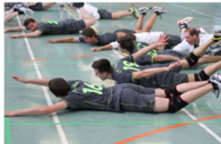
Hechtbagger gen Fans nach dem Abpfiff des frischgebackenen Aufsteigers.

athletisch überlegenen, erfolgshungrigen Spieler von Trainer Wilfried Weißer nicht mehr zu bändigen. Der SV Lengede wurde unter frenetischem Beifall der zahlreichen Zuschauer an die Wand gespielt und mit 3:1 Sätzen in die Bezirksliga geschickt. GW hat nun ein 2. Landesligateam, somit kann man gelassen in die Zukunft schauen, der Unterbau passt!