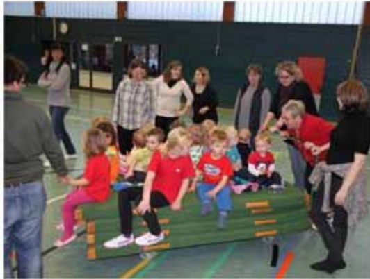
Mehr Kinder als Matten! Da haben auch Eltern und die Übungsleiterin ihren Spaß!

Durch die Sperrung der Turnhalle mussten auch einige Sportutensilien für das Kinderturnen ausgetauscht werden. Die Firma Löhmann hat sich sofort und kostenlos bereit erklärt diese Gegenstände auszutauschen.