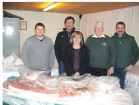
Das Bild zeigt von links die 5 Gewinner des Schweinepreisschießens 2013.