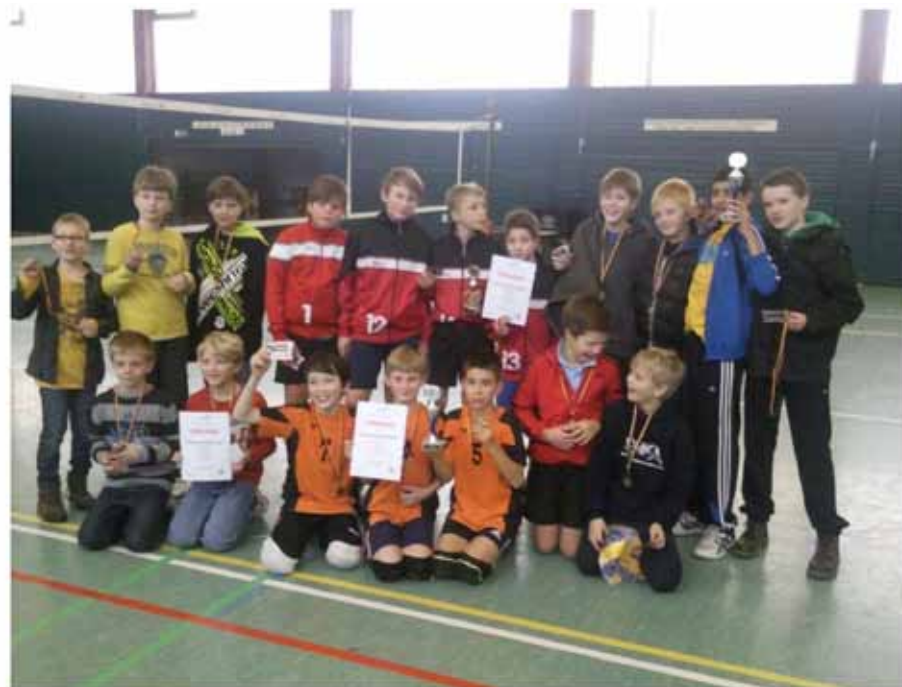
Teilnehmer der Endrunde um die Bezirksmeisterschaften in Vallstedt aus den Vereinen VT Groß Ilsede, MTV Vechelde, USC Braunschweig und GW Vallstedt