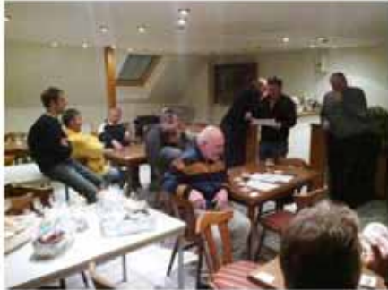
Siegerehrung: Alle warten noch gespannt auf ihre Platzierung

Über den Zuspruch beim diesjährigen Preisskat zeigten sich die Veranstalter der Alten Herren etwas enttäuscht, dennoch entwickelten sich an den 4 Tischen spannende Spiele.