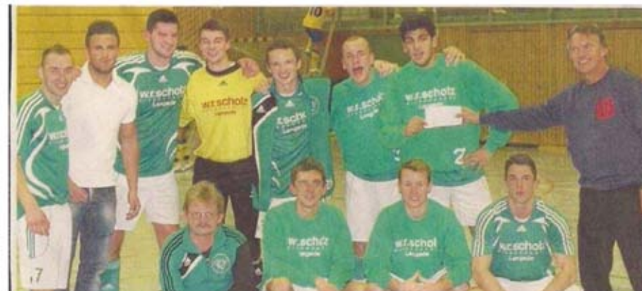
Holten sich Sieg und Scheck in Lebenstedt ab, die dominanten Sieger von GW Vallstedt.