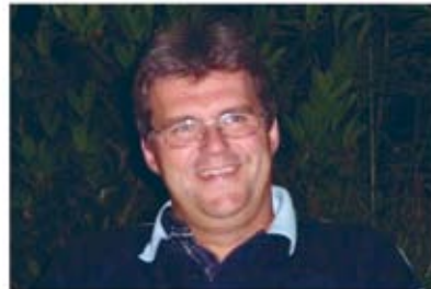
Aufgrund seiner jahrzehntelangen Treue zum Verein und seiner sportlichen Erfolge im Jahr 2011 zum Sportler des Jahres gewählt.

meister. Außerdem gewann er im letzten Jahr sowohl im Einzel wie auch im Doppel den Arno-Pretorius-Gedächtnispokal. Er war damit 2011 der erfolgreichste Tischtennisspieler des Vereins.