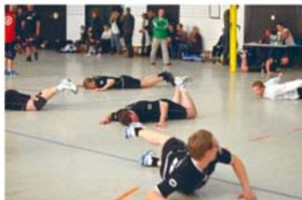
Vallstedt am Boden? Denkste, die Spieler drücken ihren Jubel über den Sieg mit einem gemeinschaftlichen Hechtbagger aus!

Bis dahin ist es allerdings noch ein steiniger Weg, aus den letzten 6 Begegnungen brauchen die Grün-Weißen 4 Siege um die Meisterschaft perfekt zu machen.