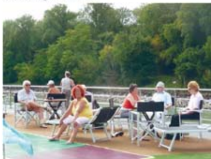
Ein Teil unserer Reisegruppe an Deck der MS Alina

Von Passau aus machten wir eine Donaukreuzfahrt mit der MS Alina, die uns nach Budapest, Bratislava und Wien führte. Bei sehr schönem Wetter konnten wir die wunderbare Landschaft und die drei Hauptstädte genießen.