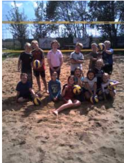
Haben besonders im Sand der Beachanlage mächtig Spaß am Volleyball, die Kinder der neuen AG an unserer Schule.

Die 2. Neuheit im Volleyballgeschehen ist die Installation einer Arbeitsgemeinschaft für die Schüler der 3. und 4. Klasse. Durch den Status der Gesamtschule war es nun möglich, eine AG in Sachen Volleyball ins Leben zu rufen.