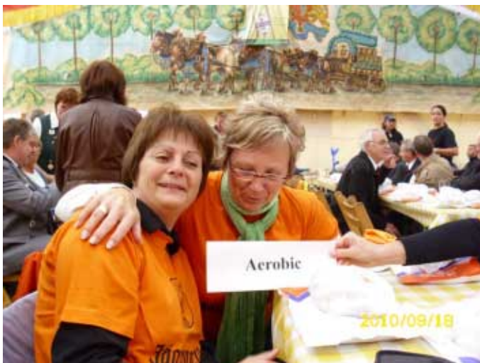
Volksfest ohne Aerobicabteilung geht gar nicht!