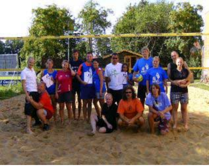
Gutes Wetter, gute Laune! Alle Teilnehmer hatten viel Spaß bei herrlichem Sonnenschein.

Der bereits zum 10. Mal ausgetragene Fun-Cup für Mixed-Teams auf der Vallstedter Volleyballbeachanlage fand in diesem Jahr bei herrlichen Temperaturen statt. 8 Teams waren angetreten um den Turniersieg einfahren zu können. In 2 Vierergruppen ging es über 2 Sätze jeder gegen jeden erst einmal um die Qualifikation für die Halbfinalspiele.