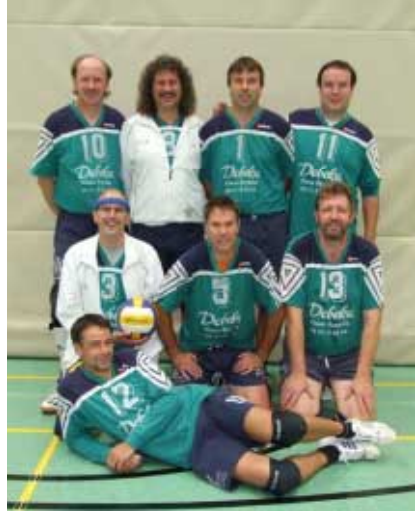
Haben sich erstmals den Pokal der Region Braunschweig-Süd gesichert, Vallstedt's 2. Volleyballherren.