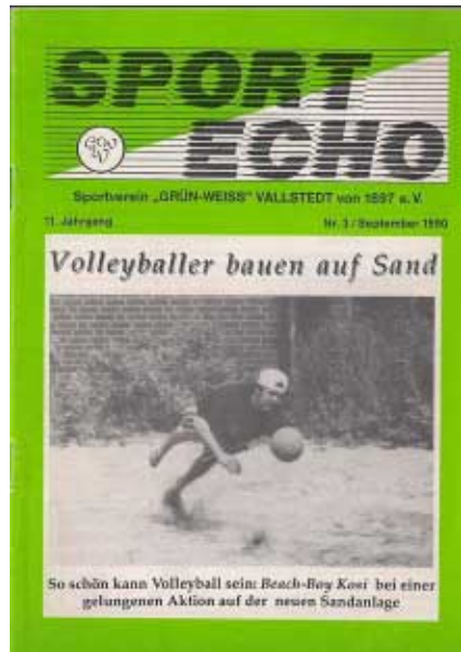
Als erster im Kreis Peine können die Vallstedter Volleyballer nun eine Beachvolleyballanlage bespielen.

Die Saisonvorbereitung läuft ausschließlich mit Siegen erfolgreich an.