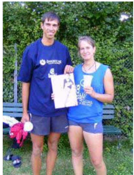
Die Fun-Cupsieger zeigten ansprechende Leistungen und beherrschten das Turnier.