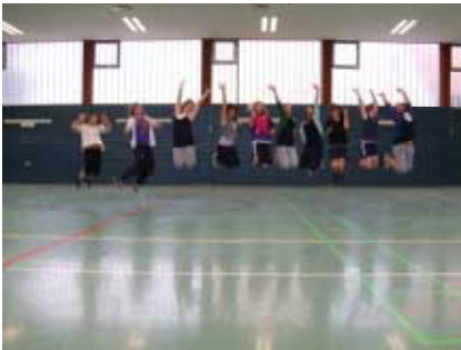
Ist schon gut in Form, unsere neue jugendliche Tanzgruppe

Trotzdem freuen wir uns immer über Besucher und Besucherinnen, welche dienstags ab 17