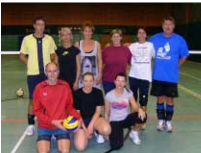
Trifft sich immer donnerstags, die neue Hobbyvolleyballgruppe von „Grün-Weiß“

Falls das auch etwas für dich sein könnte, wir sind für jedes neue Gesicht dankbar. Schau doch einfach mal vorbei!