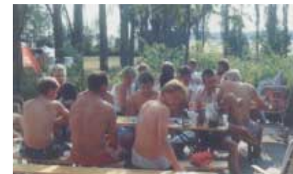
Auch in den Anfangszeiten im Sommer gut gesucht: Die Beachvolleyballanlage.

Als letztes Projekt haben die Volleyballer ein schönes Gartenhaus zur Unterbringung Gerätschaften gekauft und aufgebaut.