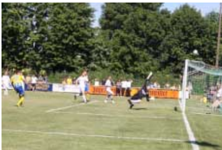
Wieder nichts! Eine der vielen Paraden von Sascha Oehmigen verhindern das nächste Eintracht-Tor.

Telefon (0 53 00) 14 27 · Telefax (0 53 00) 90 15 88