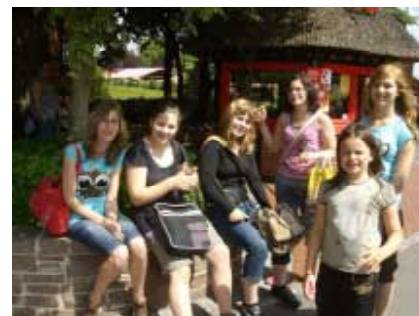
Nur fröhliche Gesichter bei bestem Wetter

31241 Ilsede / Gerhardstraße 44a / Tel. 0 51 72 - 43 98