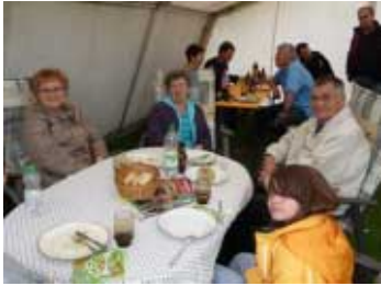
Party im Garten des Abteilungsleiters nach den Vereinsmeisterschaften.

reich verteidigen. Auch hierzu Herzlichen Glückwunsch.