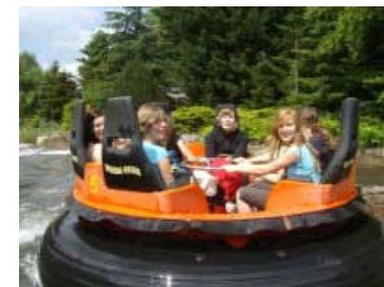
Voll in Action: Die Volleyball-Kids