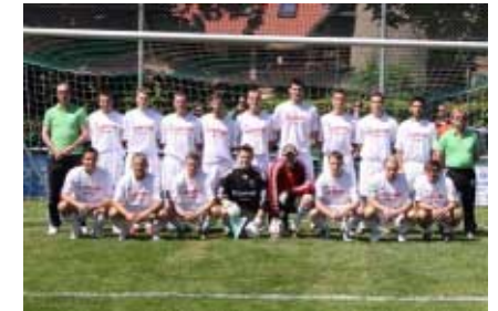
Mit dieser Mannschaft erreichten die Vallstedter ein durchaus beachtliches 0:3 gegen den Drittligisten.

Ebenso haben die Rahmenbedingungen für diese Veranstaltung gepasst, das Wetter hat mitgespielt, die Organisation war gut und die Macher können zufrieden sein.