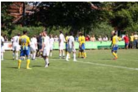
Viel los im Vallstedter Strafraum, torgefährlich wurde es aber Dank der guten Abwehrleistung der „Grün-Weißen“ eher selten.