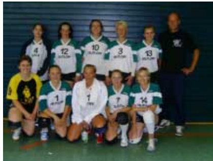
Unterlagen im 2. Aufstiegsspiel zur Landesliga, die 1. Damen von „Grün-Weiß“

Saison geschafft. In der Landesliga weht aber ganz sicher ein rauer Wind, ohne Verstärkungen wird die kommende Saison ganz schwer für den Aufsteiger. Einige neue Gesichter hat man schon beim Training gesehen, hoffentlich können sie auch für unsere Farben gewonnen werden.