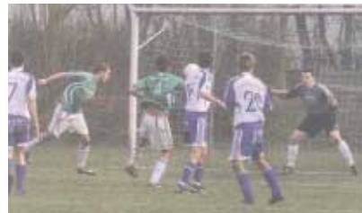
Spitzenreiter gestürzt! Gegen den MTV Wolfenbüttel konnte daheim gewonnen werden.