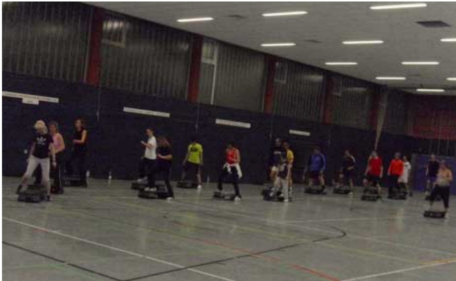
Immer gut besucht, das Step-Aerobic Training am Donnerstagabend

Aerobic-Training zu absolvieren. Obwohl diese Idee nicht ganz neu war, denn vor Jahren auf einer Jahreshauptversammlung ist diese Idee schon mal auf den Plan gebracht worden, allerdings ohne Terminangabe, hat also nicht geklappt. (Wisst ihr eigentlich wie lustig so eine Jahreshauptversammlung anschließend sein kann? Ihr solltet unbedingt mal daran teilnehmen, echter Geheimitipp)!!!!