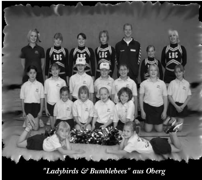
"Ladybirds & Bumblebees" aus Oberg