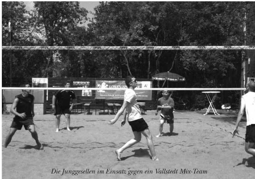
Die Junggesellen im Einsatz gegen ein Vallstedt Mix-Team