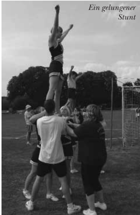
Ein gelungener Stunt

Ein großes Lob auch für die harten Jungs und Girls, die sich 3 Nächte hinten die Club-Theke gestellt haben, um immer für eine Erfrischung zu sorgen!