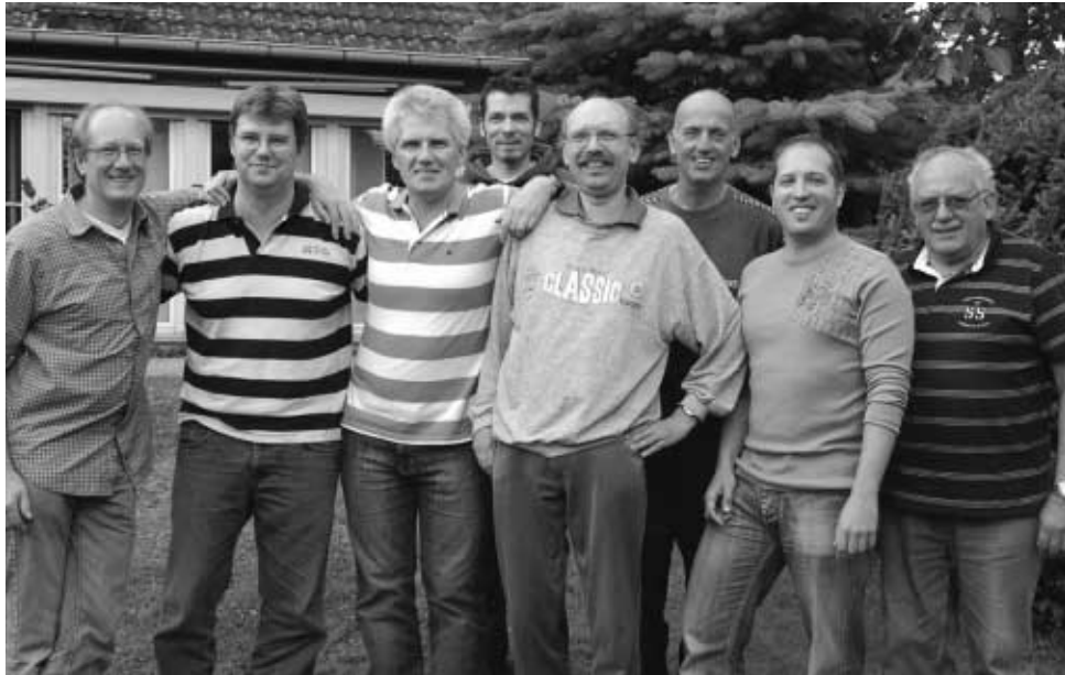
TF-Spieler auf der Grillparty der Meisterschaft