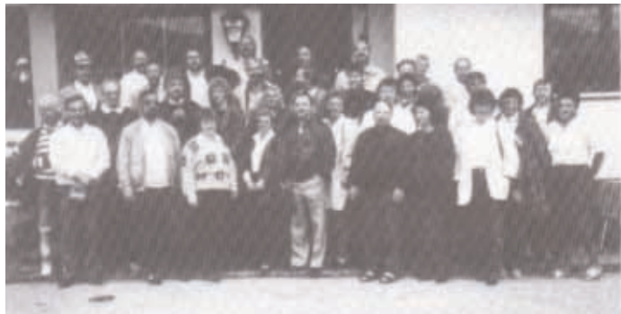
Zu einer gemeinsamen Fahrt nach Itter (Österreich) brechen die Fußballsenioren auf.