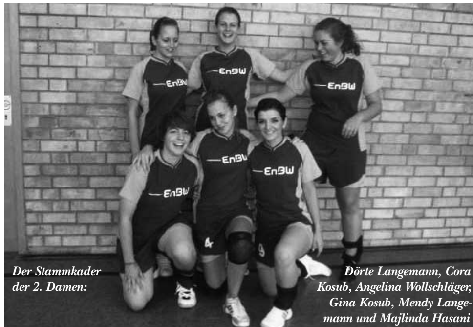
Der Stammkader der 2. Damen:

Nach 2 Auftaktniederlagen präsentierte sich die 2. Damenmannschaft in der Bezirksklasse mit einer besseren Leistung. Nach dem der erste Sieg gegen Stederdorf/Wipshausen eingefahren war zwang man im 2. Spiel den haushohen Favoriten aus Gamsen immerhin in den Tie-Break und kassiert nur eine ganz knappe Niederlage.