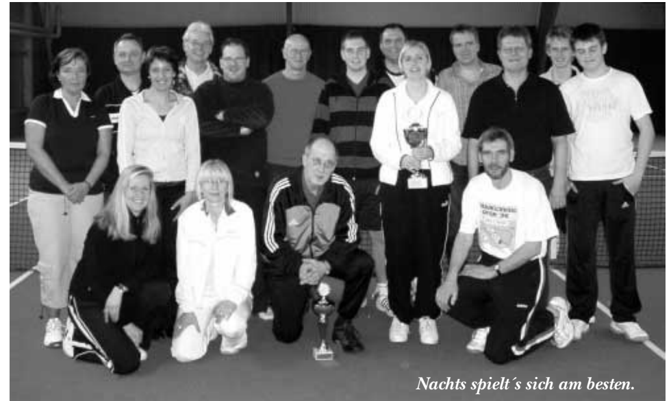
Nachts spielt's sich am besten.

Na also, geht doch – wir sind begeistert – 16 Teilnehmer beim Mitternachts-Tennis in Wendeburg – tolle Resonanz – 5 Damen und 11 Herren - was wollen wir mehr !!