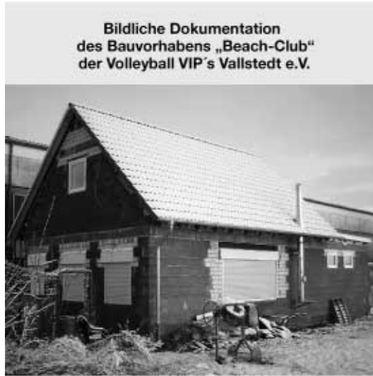
Bildliche Dokumentation des Bauvorhabens „Beach-Club“ der Volleyball VIP's Vallstedt e.V.

*** Beachwart Timo Rogner hat für den 19. und 27. April Arbeitseinsätze auf der Beachanlage jeweils ab 10 Uhr angesetzt.