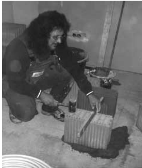
Auch die, die es nicht können, versuchen es immer wieder - jeder kann helfen.

Mittlerweile ist der Estrich ins Clubheim bebracht und der Bau der Theke hat begonnen. Noch im April sollen die Bo-