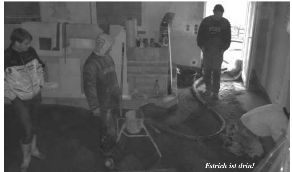
Estrich ist drin!

Bahnhofstraße 6a/Forum 38300 Wolfenbüttel Tel. 0 53 31/905 606 www.orthofit-schuhtechnik.de Öffnungszeiten: Mo.-Fr. 9.00-13.00 und 15.00-18.00 Uhr Mi. nachmittags geschlossen