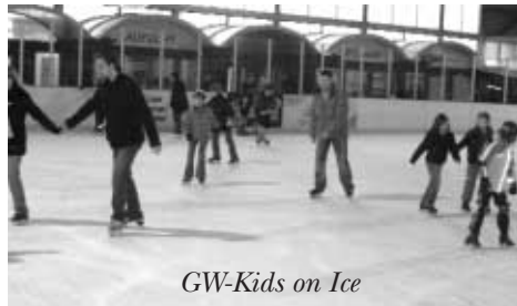
GW-Kids on Ice

Nun geht es weiter in der Vorbereitung für die nächste Saison, da die großen