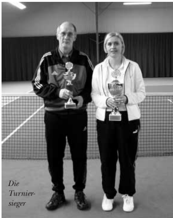
Die Turnier- sieger

Teilweise wurden die Spiele mit grossem Ehrgeiz gespielt, dass lag sicher an unseren Wanderpokalen, welche jeder mal gewinnen möchte.