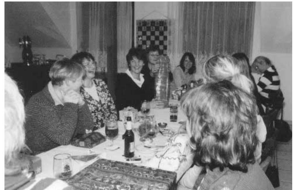
Doch noch das Gruppenfoto, die Druckerpressen liefern schon, aber es ist drin.

Die diesjährige Weihnachtsfeier fand in „Minni's Bierquelle“ statt. Leider waren auf der Weihnachtsfeier nicht so viele anwesend, wie in den Jahren zuvor, weil einfach zu viele andere Weihnachtsfeiern waren. Im nächsten Jahr wird die Weihnachtsfeier wahrscheinlich wieder im November stattfinden, damit wieder alle dabei sein können. Nach den anfänglichen Formalitäten wie Einsammeln unseres Jahresbeitrages von 5 Euro für unsere interne Kasse, von der Startgelder