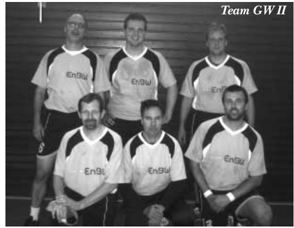
Team GW II

Unser neues Team II schlägt sich in der neuen Bezirksliga hingegen ausgezeichnet. Die mit nur 6 Stammspielern angetretene Mannschaft rangiert auf einem hervorragenden 3. Tabellenplatz und hat schon jetzt alle Abstiegsorgen beseitigt. Die jeweiligen Aushilfsspieler haben „gestochen“ und viel zum erfolgreichen Abschneiden des Teams beigetragen.