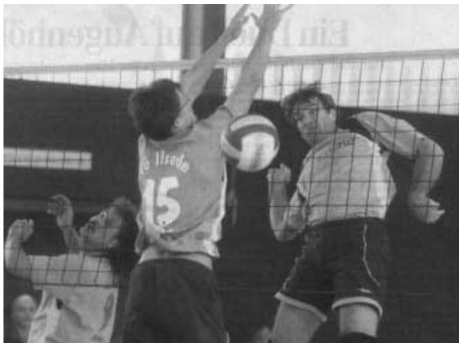
Erfolgreiche Co-Produktion von Willex & Jo sichern die nächsten Punkte

Vallstedts Oldies spielen in der Parallelstaffel eine ebenso einwandfreie Rolle. Bis auf die unnötige Niederlage in Lenge-de stimmt meist die Leistung, sodass auch hier ein guter 3. Tabellenplatz herausgesprungen ist.