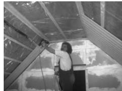
Willex beim Vertäfeln

Telefon (0 53 00) 14 27 · Telefax (0 53 00) 90 15 88