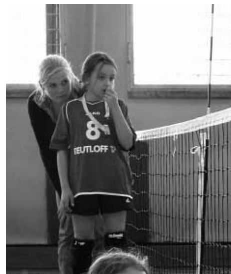
Schiedsrichtereinsatz am ersten Spieltag der E-Jugend

und C- Jugendlichen keine Mannschaft in der Jugendrunde melden können. Sollten Jugendliche im Alter zwischen 12 - 14 Jahren Interesse am Volleyball spielen haben, sind sie Montags von 16.30h bis 17.30h in der Vallstedter Halle willkommen! Natürlich auch alle anderen Kinder ab 8 Jahren!