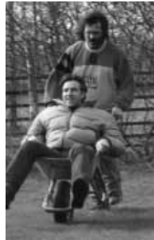
Doch ein wenig anstrengend oder Willex?

Beim Sitzkegeln zeigte sich doch, dass jeder seine eigenen Qualitäten hat. Doktoren sollen schummeln, zumindest mache und manchmal, oder.... Treffen will aber auch gelernt sein. Ja, der Geschicklichkeitslauf mit Holzpantoffeln