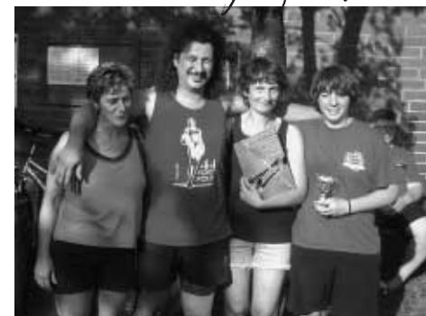
Das bestplatzierte Damenteam bei der Siegerehrung