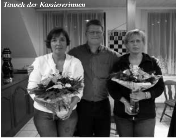
Tausch der Kassiererinnen

nicht immer einfache Aufgabe übernommen hat. Wir wünschen viel Erfolg und immer genug Geld in der Kasse!