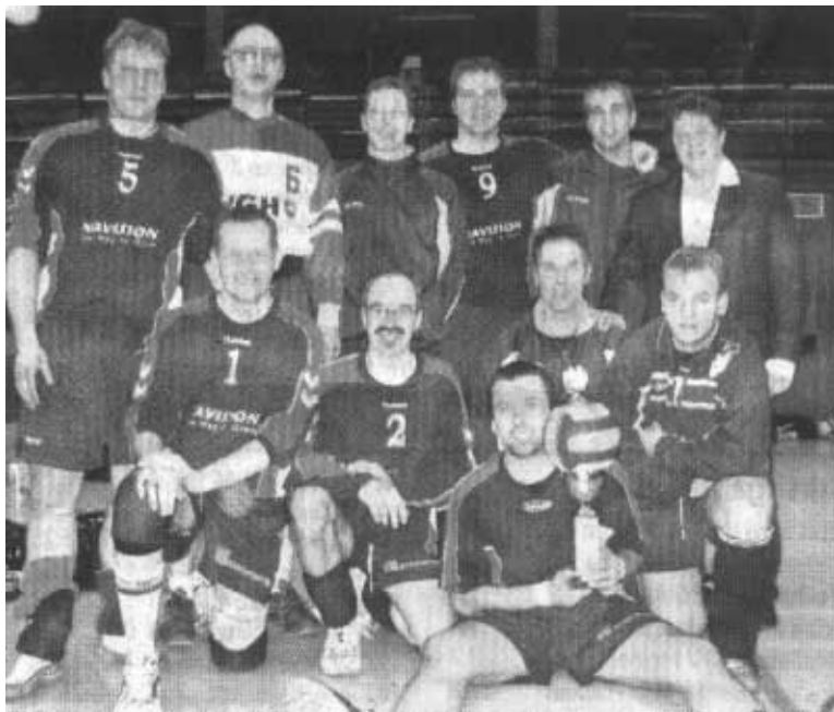
Holten zuletzt das Double mit der Bezirksklassenmeisterschaft und dem Kreispokalsieg, die 1. Herren aus Schmedenstedt in der abgelaufenen Saison, die jetzt für GW Vallstedt am Start sind.

sprächsstoff die Volleyballer aus Schmedenstedt entschlossen komplett beim S.V. „Grün-Weiß“ einzusteigen. Trainieren wird die Mannschaft zusammen mit den „Oldies“, da auch die meisten Schmedenstedter nicht mehr ganz „taufrisch“ sind. Starten werden sie wie die 2. und 3. Vallstedter Mannschaft in der Bezirksliga, wahrscheinlich als Vallstedt II um den knapp besetzten Kader notfalls