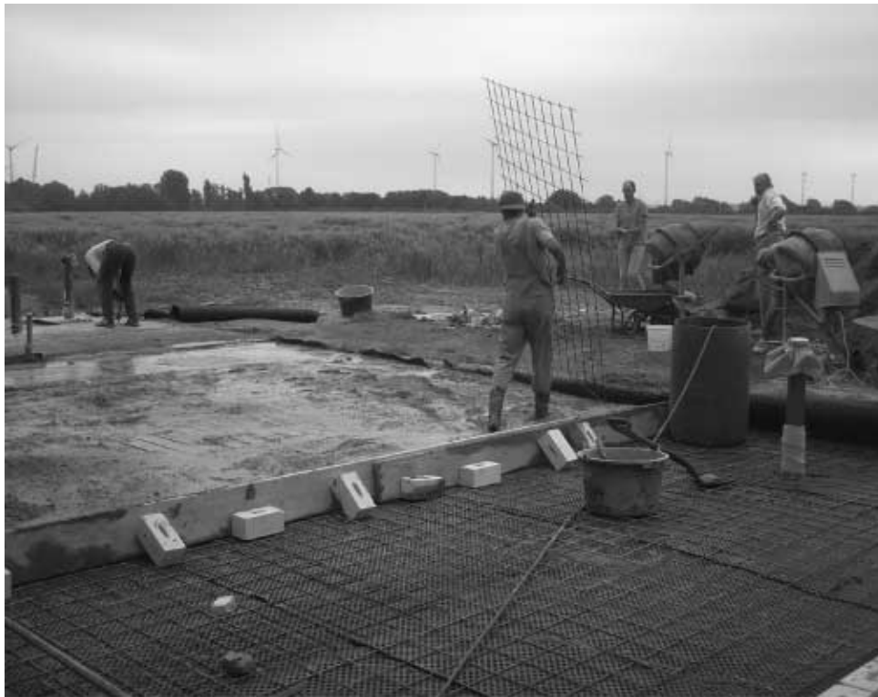
Ob wir heute noch fertig werden?