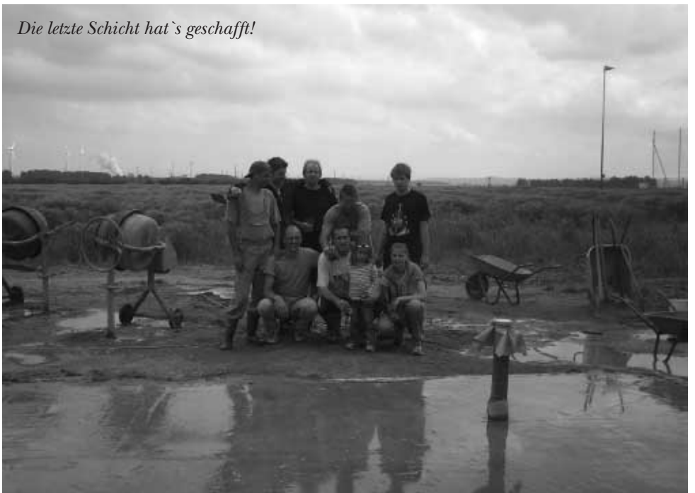
Die letzte Schicht hat's geschafft!