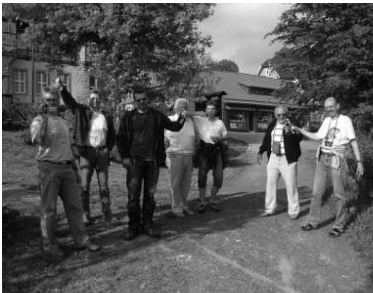
Rückkehr nach Schierke