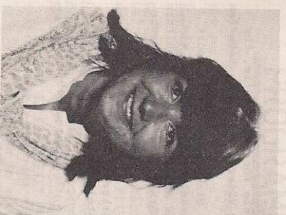
sität Gießen, seit Juli 1977 bund in Frankfurt/Main.