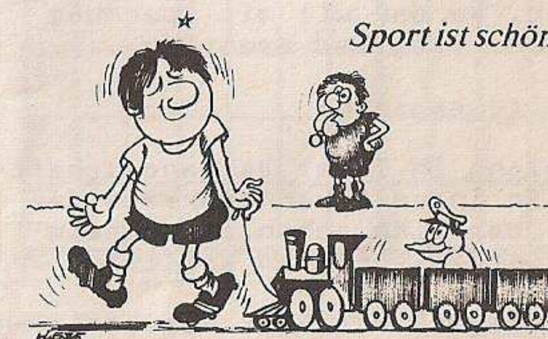
Was Sportreporter so sagen - bildlich gesehen: ... und da ist erneut Berni Ballermann im Bild, der wiederum einen seiner schönsten Spielzüge zeigt...